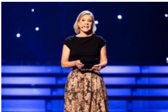
Dåvarande finansminister och nuvarande statsminister Magdalena Andersson delar ut pris till Årets Kvinnliga Idrottare på Idrottsgalan 2019.