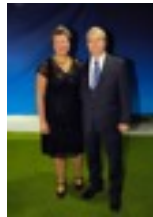
Erik Åsbrink (med Ylva Johansson)