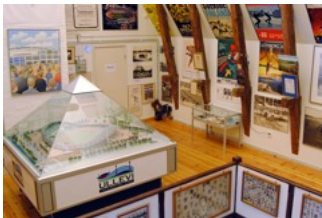
Middag på Idrottsmuseet är en av programpunkterna under det nordiska mötet i Göteborg.

Förra gången mötet arrangerades var 2011 på den danska ön Bornholm. Då deltog 129 idrottsledarveteraner i mötet. Det var 14:e gången de fyra nordiska idrottsveteranförningarna samlades till nordiskt möte. Och den gången var det Danske Idræts Veteraner som svarade för värdskapet.